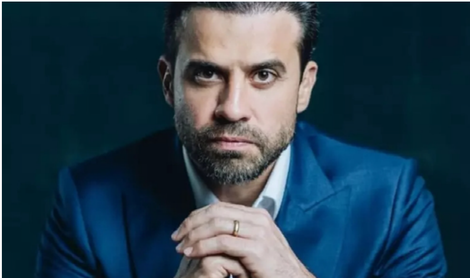
Pablo Marçal, ex-coach ficou magoado com a forma que foi tratado pelo ex-presidente Jair Bolsonaro

A publicação mais recente do ex-presidente no Facebook também traz diversos comentários críticos, com usuários se dizendo decepcionados com a falta de empenho do ex-presidente em criticar o que classificaram como censura às redes de Marçal --o candidato do PRTB teve perfis derrubados após divulgar laudo falso sobre