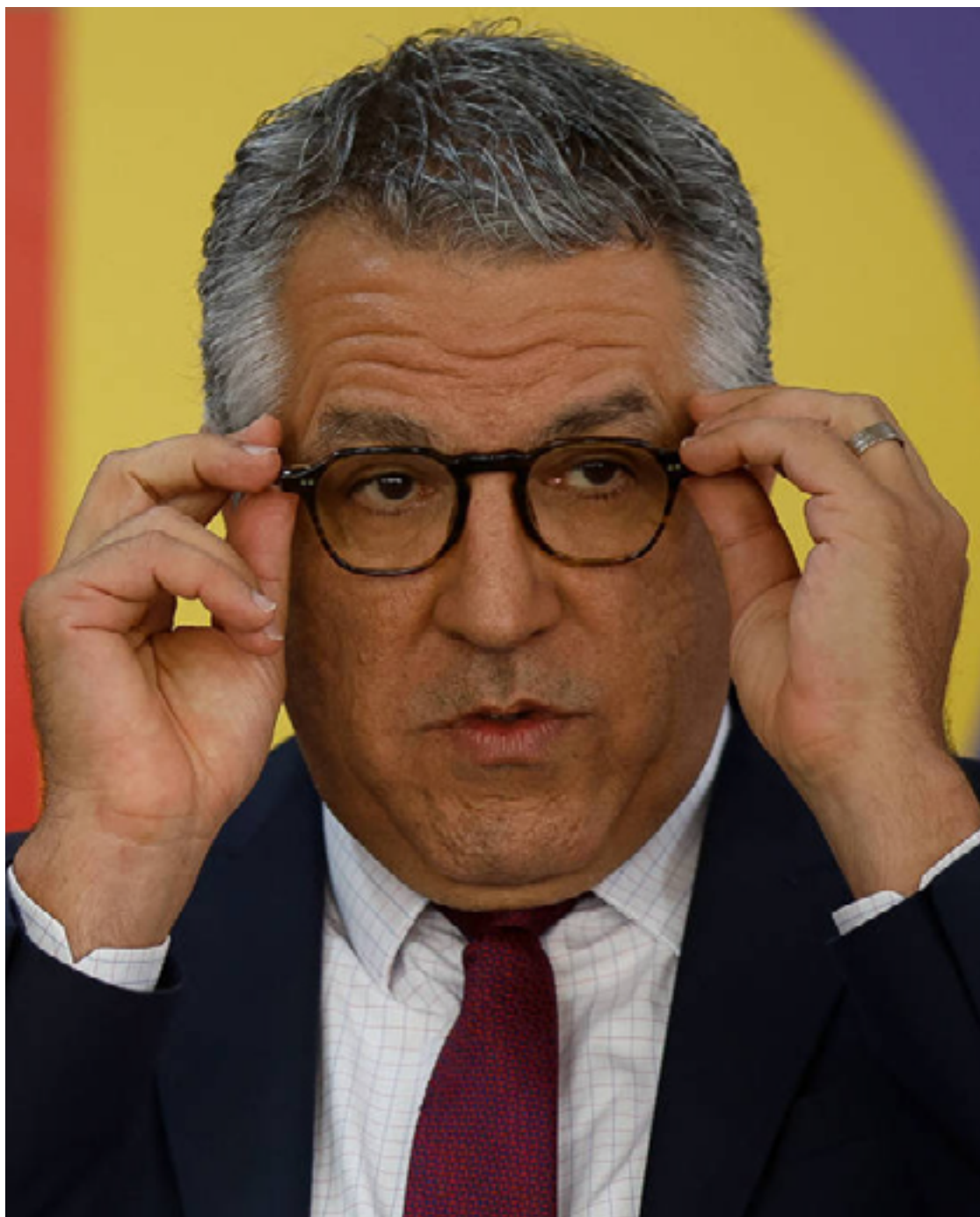
Alexandre Padilha: aliança partidária do governo Lula teve êxito nas eleições

Padilha minimizou o quadro, após reunião com o presidente Lula. “Lideranças que compõem essa frente ampla do governo, que apoiam o presidente Lula no primeiro, no segundo turno das eleições do ano passado [de 2022], derrotaram os ícones da extrema direita”, disse o ministro.