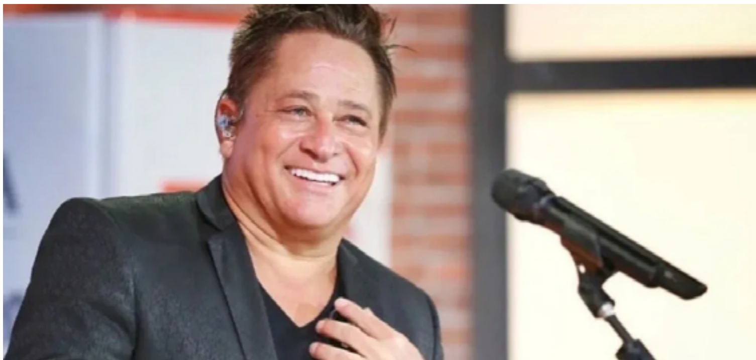
Em um vídeo nas redes sociais cantor se diz surpreso, nega as acusações e vê com tristeza a situação

A inclusão de Leonardo na lista se origina de uma fiscalização realizada em novembro de 2023 na Fazenda Talismã, localizada em Jussara, interior de Goiás. Durante a inspeção, foram encontradas seis pessoas, incluindo um adolescente de 17 anos, em condições degradantes, um dos fatores que caracterizam a escravidão contemporânea no Brasil. Essa não é a única propriedade do cantor e empresário, que também atua no setor de pecuária e recentemente investe na agricultura, especialmente no cultivo de soja.