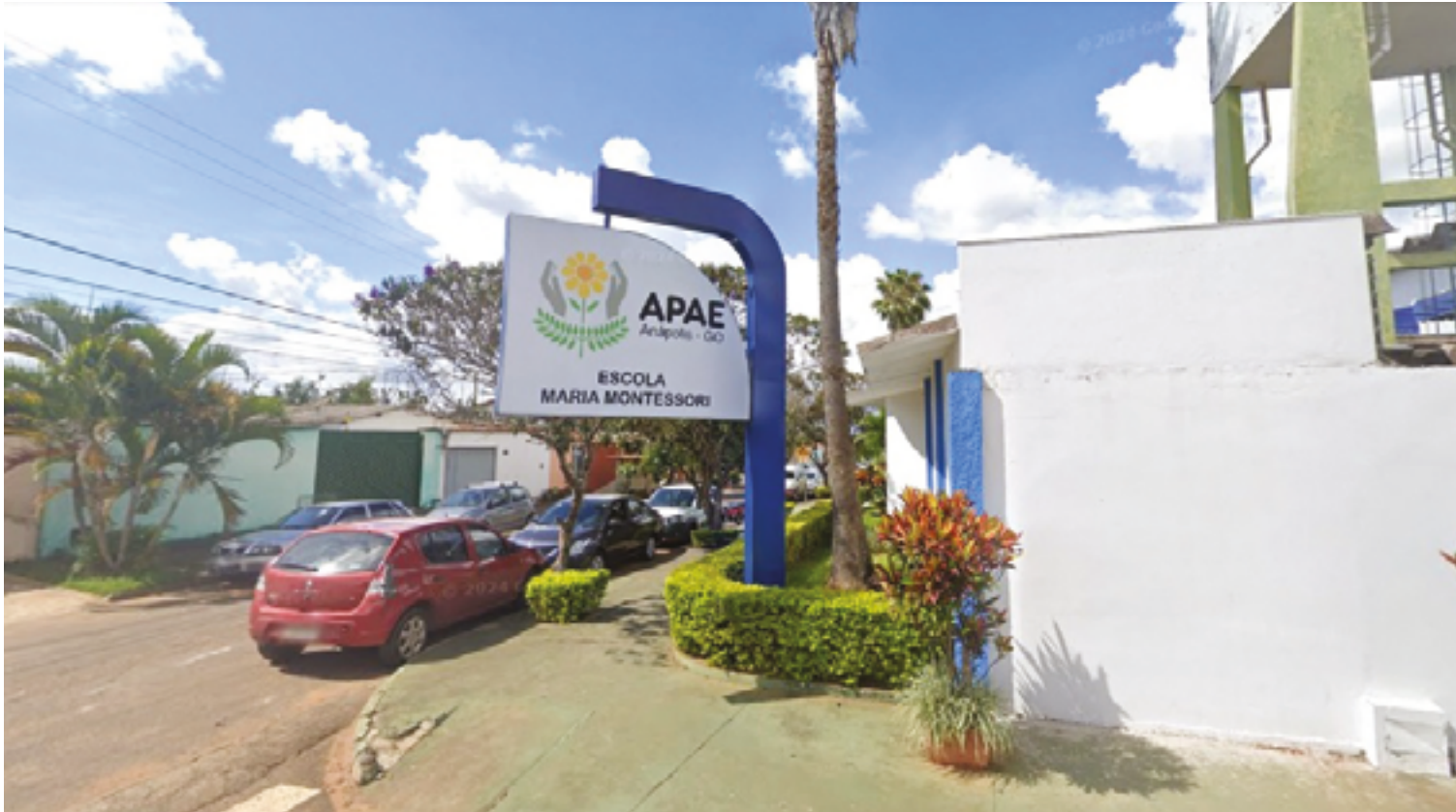
Reconhecimento anual observa a excelência em gestão, governança, sustentabilidade financeira e transparência

São selecionadas, de forma técnica e objetiva, organizações que se destacam pela qualidade de sua gestão e transparência, servindo como referência para doadores e voluntários, auxiliando a sua tomada de decisão sobre em qual entidade destinar o seu apoio financeiro e