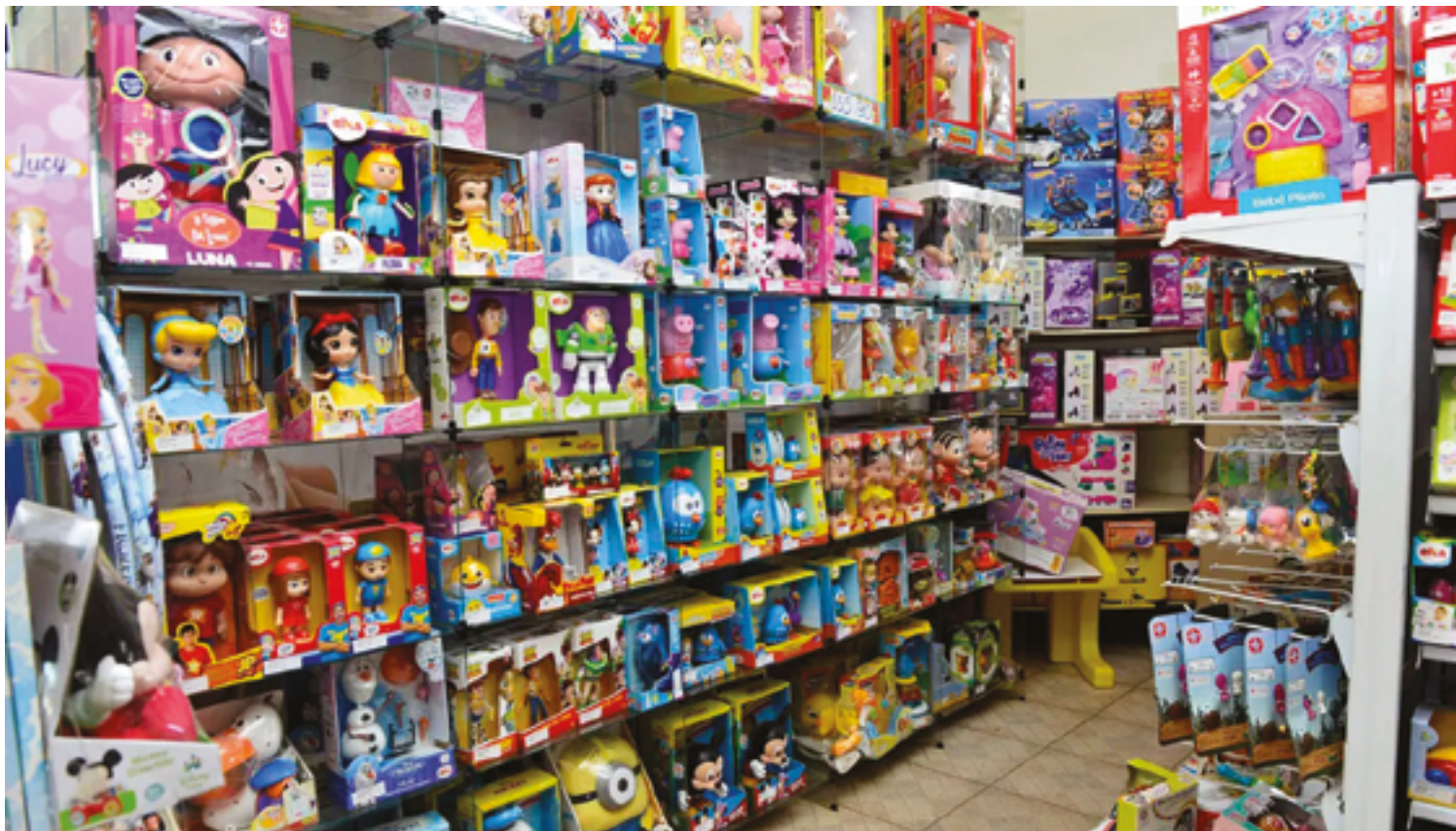
Segundo o levantamento, a maior parte dos consumidores da cidade quer gastar entre R$ 51 a R$ 100 em cada presente