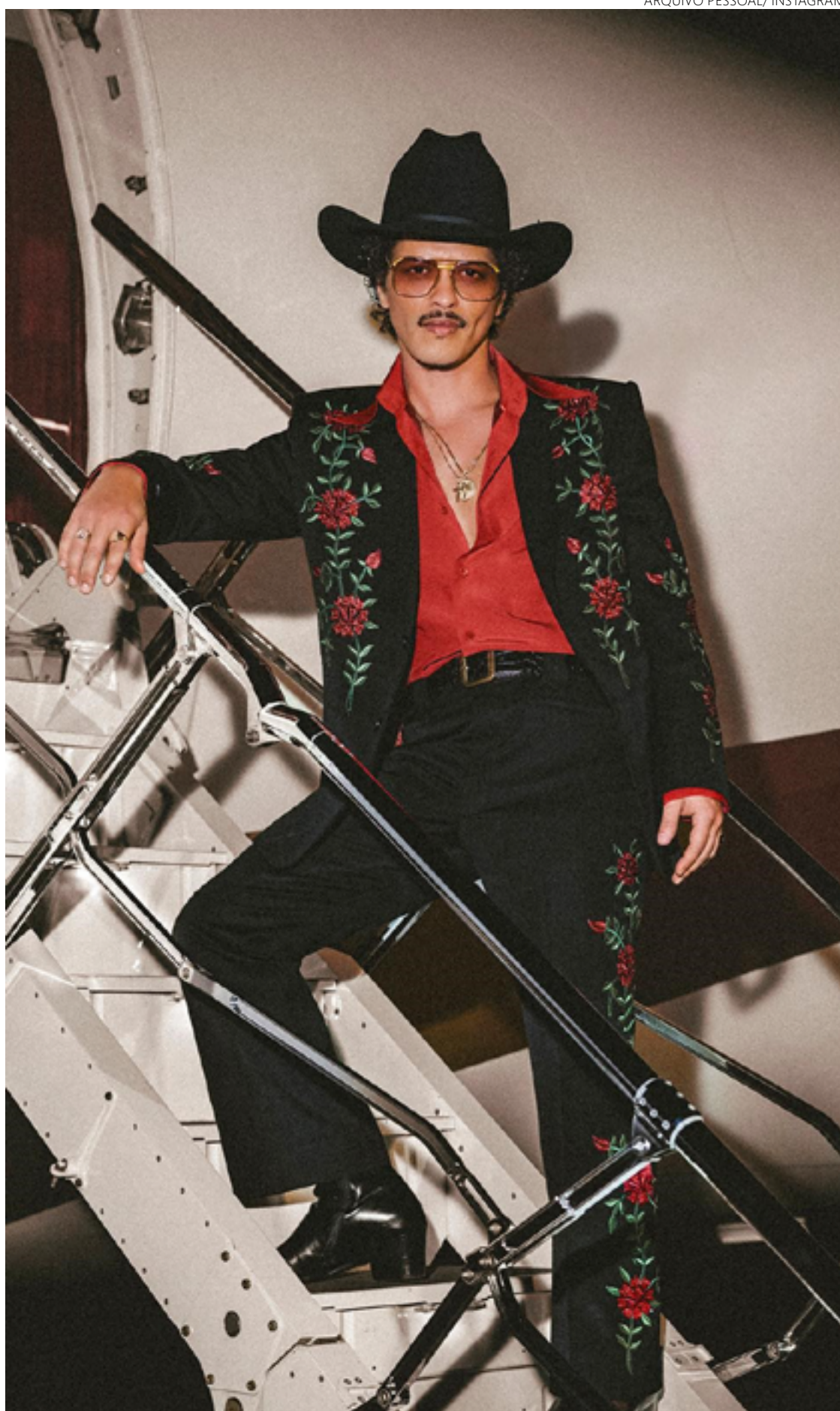
Mars levantou público durante apresentação no último fim de semana, em São Paulo

Na primeira, em 2012, passou por Florianópolis, Rio de Janeiro e São Paulo, como atração do Summer Soul Festival, e deixou claro o apreço pelo país. Vestiu uma camisa da seleção brasileira de futebol no palco e chegou a cantar um trecho em inglês de “Ai, se Eu te Pego”, sucesso de Michel Teló que era fe-