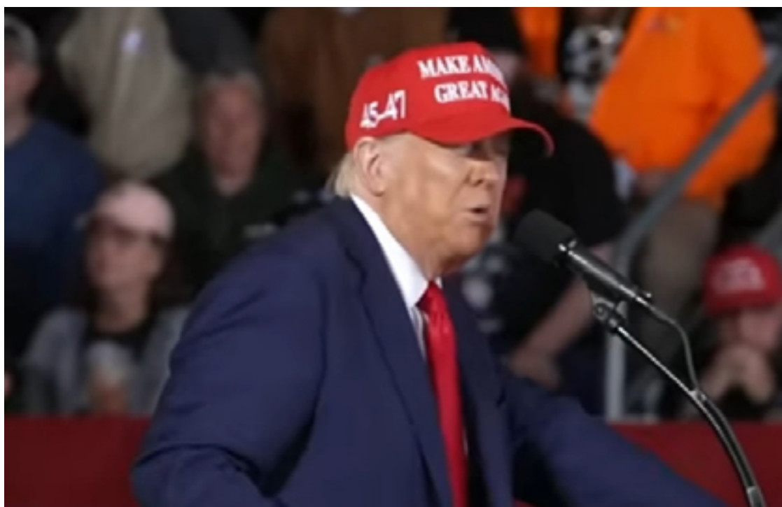
Donald Trump, candidato nos Estados Unidos: "É nojento o fato de a mídia sempre querer defender homicidas e estupradores"

Em nota, a campanha de Trump defendeu a declaração,